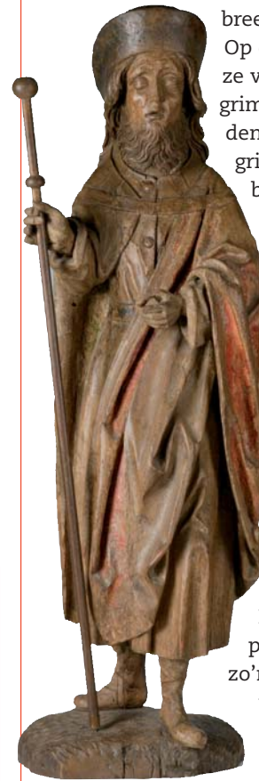
Pelgrim, Zuid-Duitsland, ca. 1490

E en pelgrimstocht is een reis naar een heilige plek om de nabijheid van God te ervaren. De heilige plaatsen kenmerken zich door de aanwezigheid van een reliek (zie infoblad Woord en Wapen ), het graf van een heilige of omdat er een heilige gebeurtenis, een wonder, heeft plaatsgevonden. Zo reizen pelgrims naar Rome om de graven van de apostelen Petrus en Paulus te bezoeken, naar Betlehem om Jezus' geboorteplaats te zien en naar Jeruzalem om daar in Jezus' voetsporen de kruisweg te lopen. Pelgrims komen uit alle lagen van de bevolking. Ze zijn makkelijk te herkennen aan hun pelgrimsstaf en