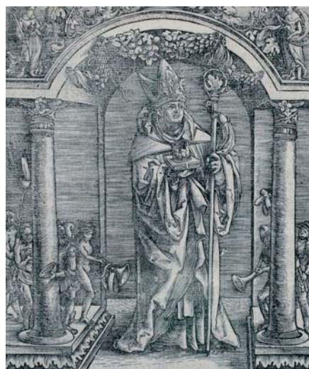
Missale ordinis sancti Benedicti (Benedictijns misboek), Hagenau, Thomas Anshelm Badensis, 1518

I n het Westen wordt vooral de gemeenschappelijke vorm, het kloosterwezen, populair. Een van de meest invloedrijke kloosterordes, die van de