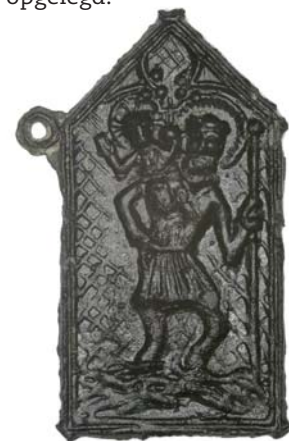
Pelgrimsteken met Sint-Christoffel, herkomst onbekend, ca. 1475

Onderweg liggen gevaren op de loer, zoals struikrovers, piraten, lawines, noodweer en schipbreuk. Toch ondernemen veel gelovigen in de Middeleeuwen de lange, gevaarlijke tochten om een aflaat te verdienen of omdat de bedevaart ze als straf en boete is opgelegd.