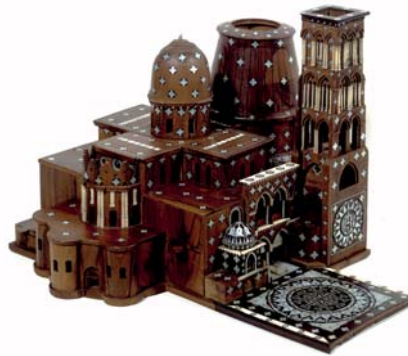
Model van de Heilige-Grafkerk te Jeruzalem, Betlehem?, ca. 1675

Voor moslims is Jeruzalem heilig omdat Isai (Jezus), voor hen een profeet, hier gestorven is. Mohammed zou hier tijdens een nachtelijk visioen naar de hemel zijn opgestegen. Op de plaats waar Mohammed naar boven zweefde, is later de Rotskoepel gebouwd. Voor de joden is Jeruzalem heilig omdat koning David deze plek tot zijn stad maakte en koning Salomo hier zijn tempel bouwde. De Klaagmuur staat op de plek waar ooit het joodse tempelcomplex stond.