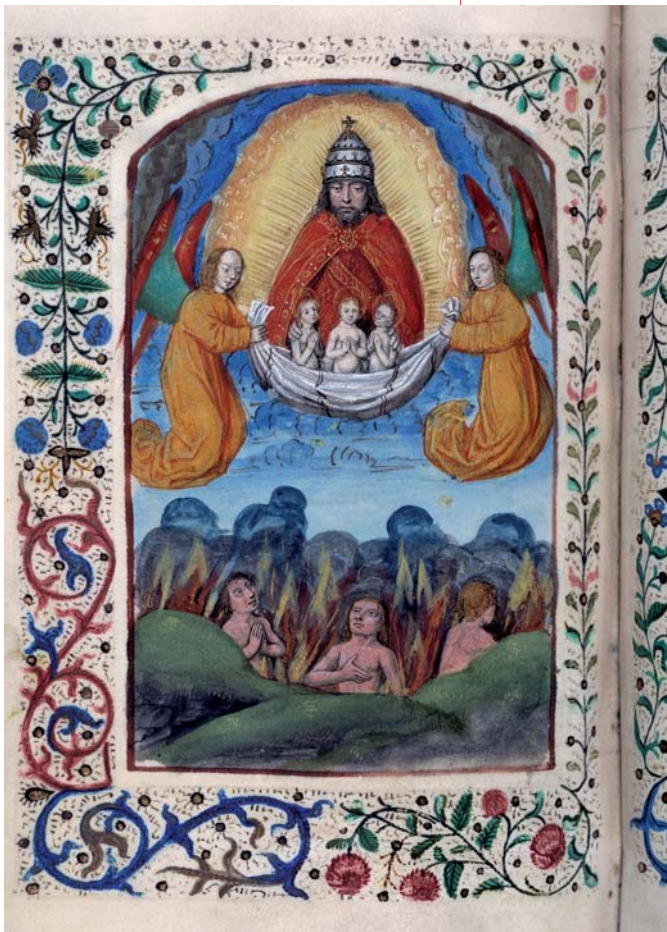
Engelen dragen de zielen in een doek van het vagevuur naar de hemel, Meester van de Woodhull-Harberton Getijden, ca. 1490-1495