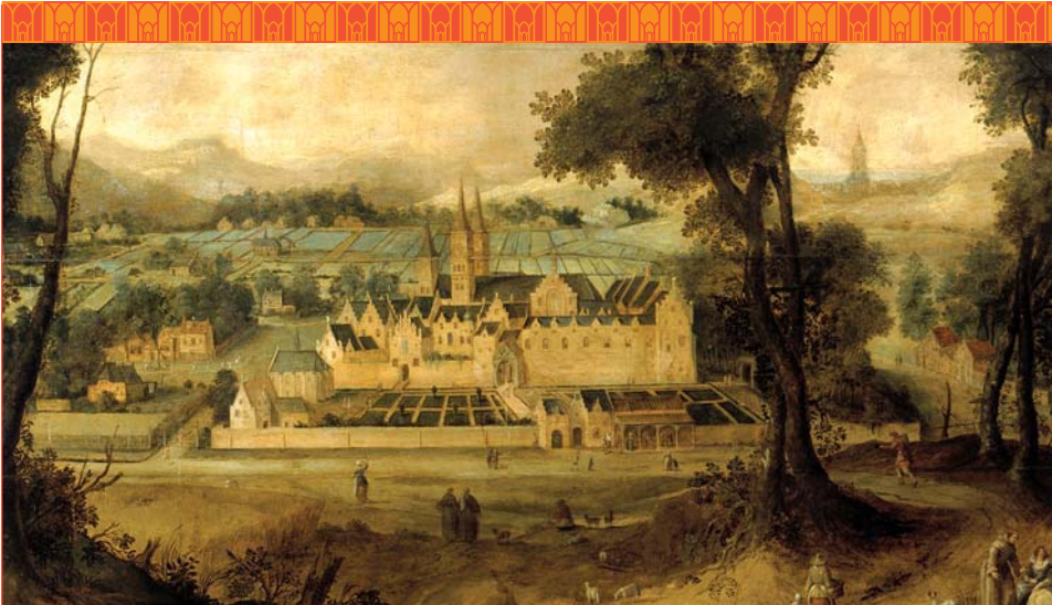
Gezicht op de benedictijner abdij van Egmond, Claes Jacobsz. van der Heck, 1635