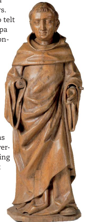
Monnik, Noord-Nederland?, 1500-1520

V olgens de overlevering krijgt de diepgelovige dochter van de Franse hertog van Montbar tijdens haar zwangerschap een visioen. Ze ziet een wit hondje in haar buik en hoort een stem: 'Je wordt moeder van een hond die het huis van God zal bewaken en zal blaffen tegen vertegenwoordigers van het kwaad.' Een paar maanden later wordt Bernardus geboren. Op zijn achtste verjaardag wordt hij naar een klosterschool gestuurd. Daar leert hij lezen en schrijven in het Latijn. Als Bernardus achttien is, sterft zijn moeder. Twijfelend aan de zin van zijn bestaan gaat hij als reactie op zijn strenge, religieuze opvoeding een losbandig leven leiden.