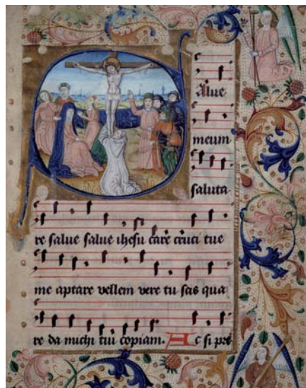
Bernardus omarmt het kruis, Zwolse Meester, ca. 1480

Wist je dat... ... Bernardus van Clairvaux in 1150 nogmaals wilde meewerken aan een kruistocht die zijn vriend abt Suger van Saint-Denis trachtte te organiseren.