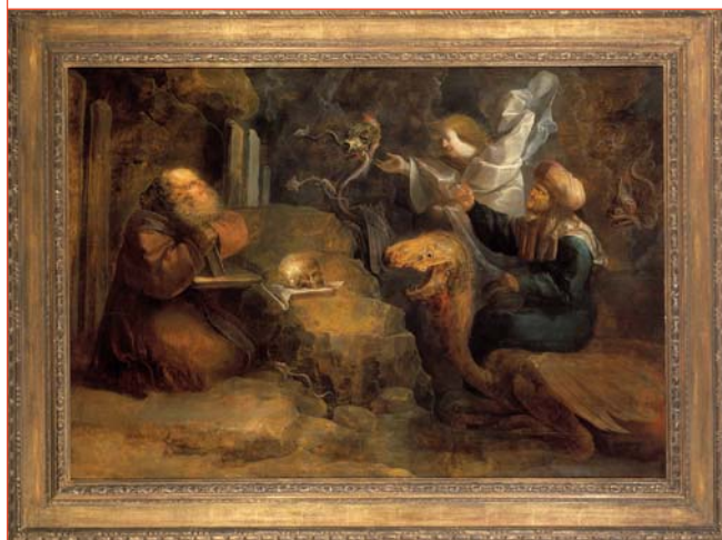
Antonius de kluisenaar, Jan van de Venne, tweede kwart 17e eeuw

Antonius houdt echter vol. Medegelovigen bewonderen zijn wilskracht en vestigen zich bij hem in de buurt. Na zijn dood wordt hij als de eerste 'woestijnvader' vereerd.